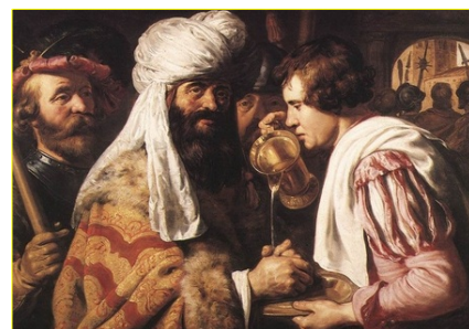
彼拉多在清洗他的手

器把耶稣钉死在十字架上。最后，胆怯懦弱的彼拉多就拿水在民众面前洗手，说：“流这义人的血，罪不在我，你们承当吧。”于是命令鞭打耶稣，并钉上十字架。