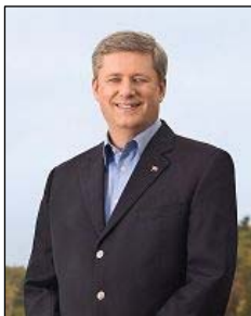
图：加拿大总理 斯蒂文·哈珀

加拿大总理、政府多次公开提出法轮功和人权问题。三月五日在日内瓦召开的联合国人权会议上，加拿大谴责世界各地发生的针对宗教团体骇人听闻的恶劣行为。在这些团体中，加外长提到了法轮功修炼者。◇