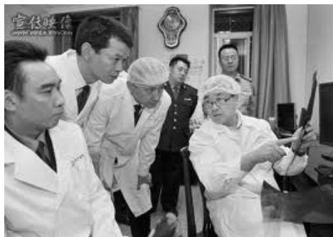
图：王立军（右一）2008 年 6 月调任重庆，指示重庆警局要加快无创解剖的实践应用

然而，不相信神并不等于神不存在；不相信因果报应，并不会不受天理的制约。古语说：“自古机深祸亦深，休贪富贵昧良心。檐前滴水毫不错，报应昭昭自古今。”（文／德元）