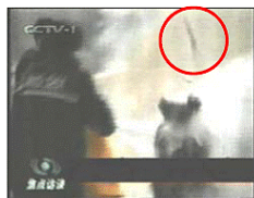
2、击打后飞出的重物