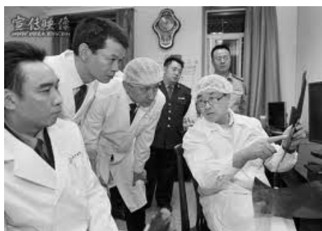
图: 王立军(右一) 2008 年 6 月调任重庆, 指示重庆警局要加快无创解剖的实践应用

然而, 不相信神并不等于神不存在; 不相信因果报应, 并不会不受天理的制约。古话说: “自古机深祸亦深, 休贪富贵昧良心。檐前滴水毫无错, 报应昭昭自古今。”(文/德元)