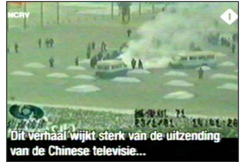
图：荷兰国家电视一台 2005 年 3 月 14 日《时事评论》专题播放法轮功节目，并揭露中央电视台“自焚”伪案，质疑突发事件中两辆警车为何备有（据中共媒体报导）20 多个灭火器。

事实上，国际教育发展组织（IED）2001 年 8 月 14 日在联合国会议上，就天安门“自焚”事件，强烈谴责中共的“国家恐怖主义行为”。声明说：从录像分析表明，整个事件是“政府一手导演的”。中共代表团面对确凿的证据，没有辩辞。该声明已被联合国备案。◇