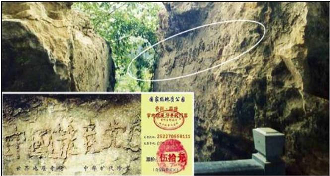
上图为“藏字石”照片，小图为风景区门票。

经实地考察后一致认为，这“藏字石”上未发现任何人工的痕迹，海内外一百多家报纸、电视、网站转发了这消息，“藏字石”的图片还被赫然印在贵州“藏字石”风景区的门票上（下图）。（在网上搜索“藏字石”即可见证！）