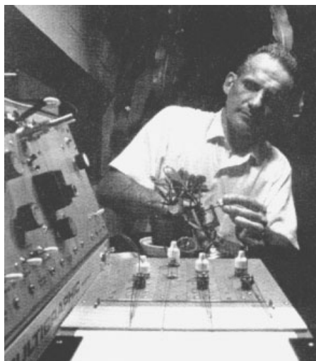
图：巴克斯特用测谎仪做植物实验

巴克斯特将两棵植物置于同一屋内，让一名学生当着一株植物的面将另一株植物毁掉。然后让这名学生混在几个学生中间，穿一样的服装，并戴上面具，一向活着的那株植物走去，最后当“毁坏者”走过时，