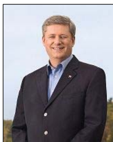
图：加拿大总理 斯蒂文·哈珀

加拿大总理、政府多次公开提出法轮功和人权问题。三月五日在日内瓦召开的联合国人权会议上，加拿大谴责世界各地发生的针对宗教团体骇人听闻的恶劣行为。在这些团体中，加外长提到了法轮功修炼者。◇