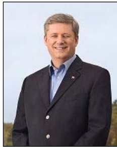
图：加拿大总理 斯蒂文·哈珀

加拿大总理、政府多次公开提出法轮功和人权问题。三月五日在日内瓦召开的联合国人权会议上，加拿大谴责世界各地发生的针对宗教团体骇人听闻的恶劣行为。在这些团体中，加外长提到了法轮功修炼者。◇