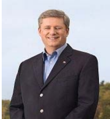
加拿大总理斯蒂文·哈珀

“加拿大法轮功学员是遵纪守法的公民，他们和他们的中国同胞，以及其他一样，为我们的国家作出了巨大的贡献。我相信将随着时间的推移，中国会同加拿大一样，大大受益于更加自