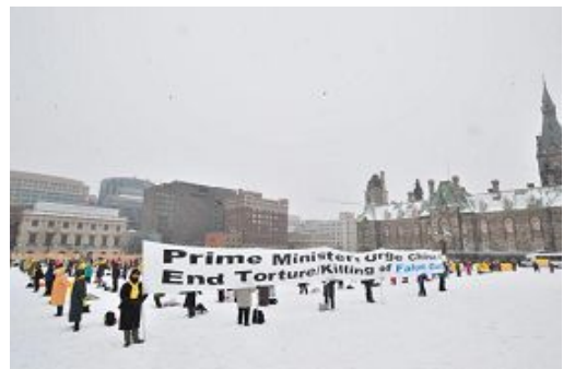
加东法轮功学员呼吁总理提出法轮功受迫害问题

哈珀出访前夕，来自加东城市的数百名法轮功学员在首都渥太华国会山前聚会，在暴风雪中呼吁总理在访华期间，提出法轮功受迫害问题。三名受迫害者（包括家属）在新闻发布会上讲述了自己或亲人在中国国内遭受的迫害。