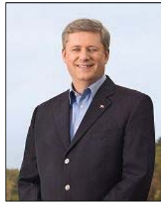
图：加拿大总理 斯蒂文·哈珀

加拿大总理、政府多次公开提出法轮功和人权问题。三月五日在日内瓦召开的联合国人权会议上，加拿大谴责世界各地发生的针对宗教团体骇人听闻的恶劣行为。在这些团体中，加外长提到了法轮功修炼者。◇