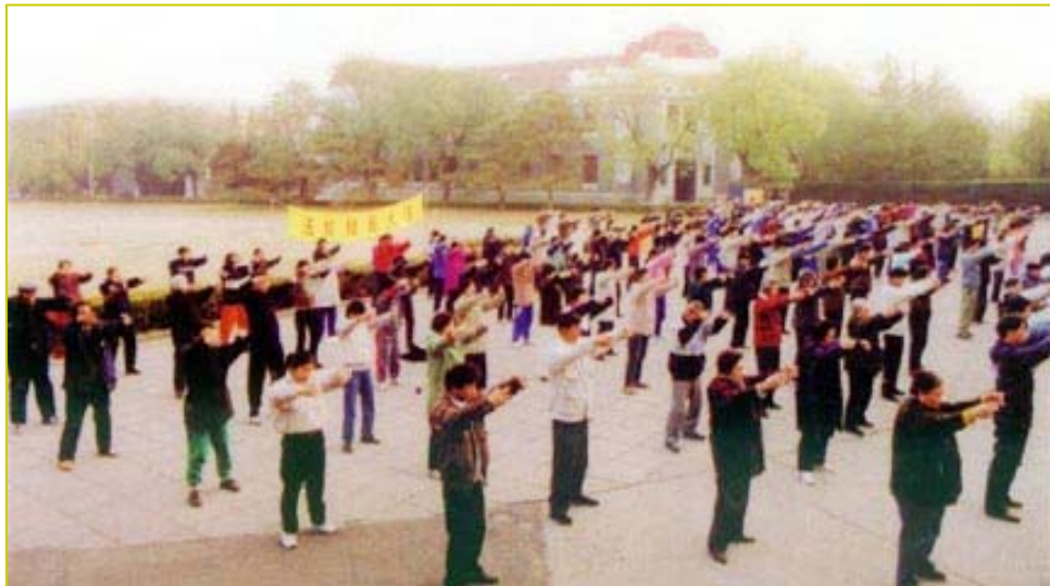
1999年迫害前，清华大学师生在清华学堂前集体晨炼法轮功

众所周知，在医药保健领域，评判新医疗、新保健、新药品的疗效，法定使用统计检验法，否则不予承