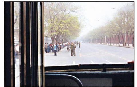
图：“4·25”当天在公共汽车中拍摄的上访人群和悠闲的警察。中南海的红墙在人群对面，街上能看到自行车行驶，根本不存在什么“围攻”。

他告诉我：“我先看看这些网站好吗？”语气中完全没有了那股强势，并充满了迫不及待的兴奋感。过了许久，我收到他传来的讯息：“你指引我看到光明！谢谢你！”我回了他一个微笑的表情。（文/小筱）◇