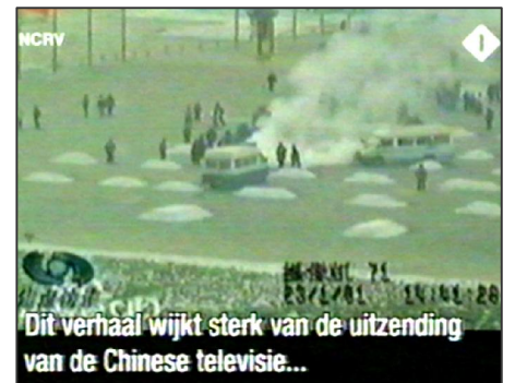
图：荷兰国家电视一台2005年3月14日《时事评论》专题播放法轮功节目，并揭露中央电视台“自焚”伪案，质疑突发事件中两辆警车为何备有（据中共媒体报导）20多个灭火器。

事实上，国际教育发展组织（IED）2001年8月14日在联合国会议上，就天安门“自焚”事件，强烈谴责中共的“国家恐怖主义行为”。声明说：从录像分析表明，整个事件是“政府一手导演的”。中国代表团面对确凿的证据，没有辩辞。该声明已被联合国备案。◇