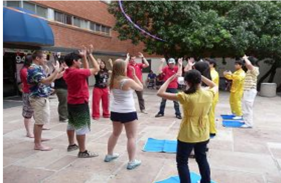
亚利桑那大学学生们踊跃学炼法轮功

【明慧网二零一二年三月二十八日】二零一二年三月二十五日, 美国亚利桑那大学 (University of Arizona) 举办校内小型世界传统文化表演会 (World Traditions Fair Performance), 介绍各国传统舞蹈和文化。法轮大法社团也参与了活动。