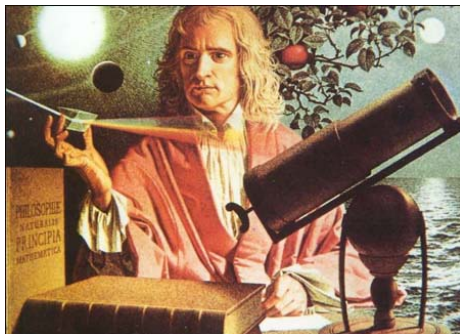
图：牛顿认为这个世界是神的杰作，正待科学家们去发现证实。