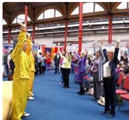
观看的民众和学员们一起炼功

一位年长的爱尔兰女士, 多年前曾经看过法轮功的书, 但是不会炼动作, 所以没有坚持下去, 这次又看见法轮功的展位, 非常高兴, 当即表示要学习动作, 但是城里的教功班对她来说太远, 学员很热情地说可以去她住的地方教她, 她很感激, 留了联系方式。