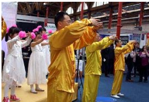
法轮功学员们展示功法

时间很短, 但是很多人表示能感受到很强的能量在身体里流动。人们纷纷表示会来参加当地法轮功学员举办的免费教功班, 学习修炼法轮功。