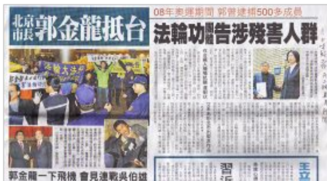
图：自由时报二月十七日以焦点新闻大幅报导中共北京市长郭金龙抵台遭到人权团体抗议事件

郭金龙因为严重参与迫害法轮功，在抵台湾的第一天即遭台湾法轮大法学会向高检署递状控告违犯残害人群罪，也是第九个受到台湾法轮功控告的中共官员，台湾各大媒体纷纷报导。