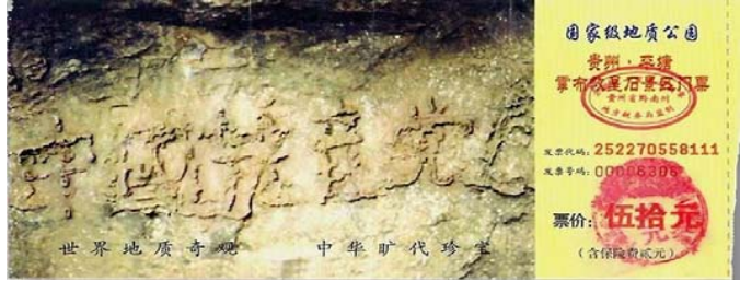
图：2002 年 6 月，在贵州省平塘县掌布乡发现了距今 2.7 亿年的藏字石，天然形成的巨石断面上，惊现“中國共產党亡”六个大字，昭示着天灭中共的天意。上图为藏字石风景区门票。

其实，国人当中从高层到百姓，有良知有智慧者大有人在，看一看一亿一千万退党大潮就可以知道。有些党政军高级官员看过《九评共产党》后，退党或者不再贪污腐败。一位正部级干部出国期间