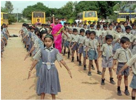
图：法轮大法在印度成千上万的学生中迅速传播，师生同炼法轮功。

终于到了他要回家的时候了。走时他告诉我说，他跟他街上的“朋友”断了关系了。我很高兴，但仍没把握，担心他回家后会不会网瘾又发作？过了一段时间，他父母高兴地说他已经不太上网了，而是在家静心学习；被父母教导时，