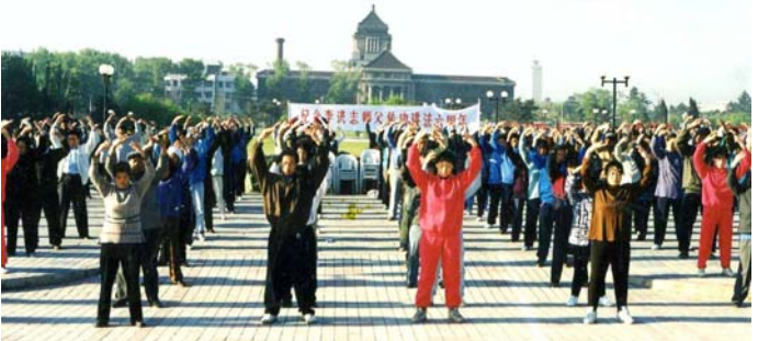
历史图片：长春法轮功学员集体炼功（1998年5月）

好心的同事们把我急送医院抢救，据当时的医生讲，再晚来会儿估计人就完了，算是捡回一条命。原来，我的心脏出了问题。我一听吓了一跳，这无异于判我死刑。我的身体那可是没的说，从小到大一直结实，还没吃过药打过针，在大学期间，我是