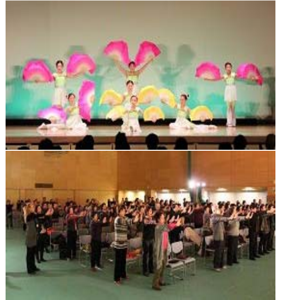
上图：明慧学校的法轮大法小弟子表演舞蹈 下图：全场观众起立与台上的明慧学校师生一起炼法轮功第一套功法

人们对悬挂着“法轮大法好，真善忍好”书签的纸折小莲花很感兴趣，表示要把这么精致漂亮的艺术品作为护身符挂在车上。还有的了解到这纸莲花是明慧学校的师生亲手做的后，表示这莲花太珍贵了，要珍惜收藏。◇