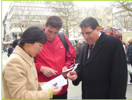
巴勒斯坦的世乒赛球员在听真相

德国多特蒙德市是一座体育名城，今年是第三次举办世乒赛，迎来了六万名来自超过一百四十个国家的参与者。世乒赛期间，很多国家的民众通过法轮功学员了解到，中国除了乒乓球有名外，更有一种气功受到欢迎，在中国曾有一亿人修炼，如今