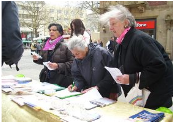
民众签名谴责中共活体摘取法轮功学员器官