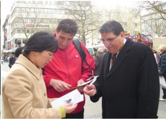
巴勒斯坦的世乒赛球员在听真相

【明慧网】二零一二年三月二十五日至四月一日, 第五十二届世界乒乓球锦标赛在德国西部城市多特蒙德举行, 来自德国北威州的法轮功学员举办信息日, 向当地民众以及来访者讲述法轮功真相。