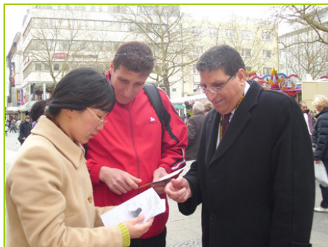
巴勒斯坦的世乒赛球员在听真相

德国多特蒙德市是一座体育名城，今年是第三次举办世乒赛，迎来了六万名来自超过一百四十个国家的参与者。世乒赛期间，很多国家的民众通过法轮功学员了解到，中国除了乒乓球有名外，更有一种气功受到欢迎，在中国曾有一亿人修炼，如今