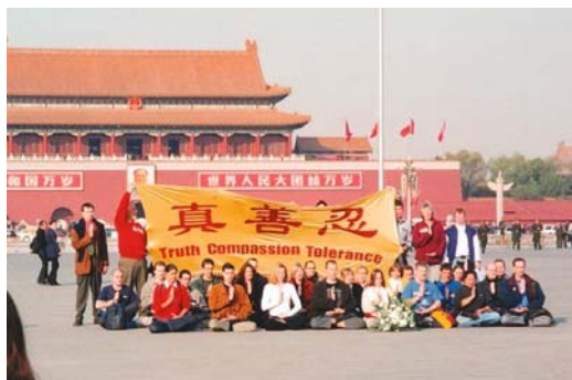
2001 年 36 位西方法轮功学员天安门请愿

法轮功修炼者身上看到了中华民族的希望！我们不能看到正义、道德、良知被践踏！不能看到好人被冤枉、被残酷地迫害，帮助他们是我们的责任！我们不应麻木、懦弱、冷血、亵渎责任！如果无辜的好人被非法审判治罪，若干年后这个荒谬的历史会让我们的后代难以理解！这将凸显了我们这个时代的自私、疯狂、急功近利，形成会有人不择手段用人血馒头邀功请赏！它还将告诉我们那些打着各种神圣名义的罪恶将得以大行其道！”