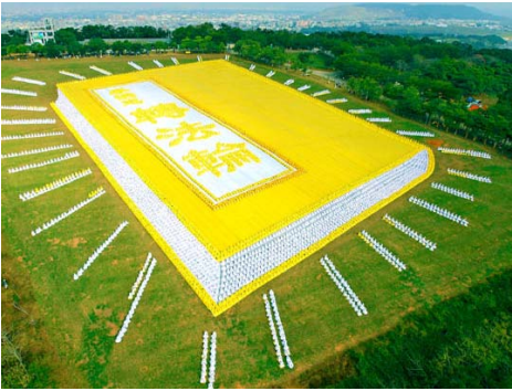
2009 年 11 月 21 日，六千多名亚太地区的法轮功学员举办大型排字活动，在台湾台中县外埔乡面积达十公顷的青青草原，排出了巨型《转法轮》。

功而成为禁书，但却是“越禁越热”，十年来透过“自由门”等翻墙软件在网络下载此书的中国民众，已经难计其数。