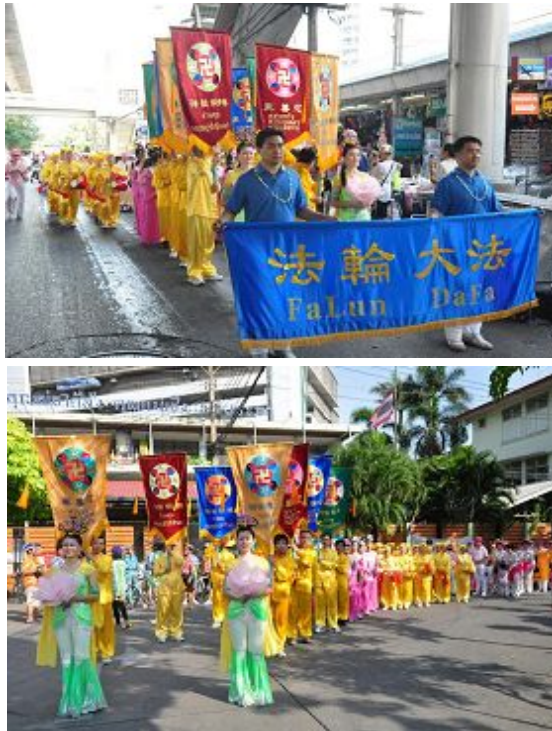
法轮功学员参加泰国泼水节庆祝游行

游行队伍穿过了曼谷繁华的区域，沿途不少游人争要法轮功学员赠送的莲花、真相资料等。游行结束时，主办单位向法轮功学员赠送了纪念品。