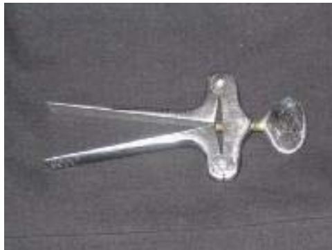
野蛮灌食用的开口器

还被关入小间,长期受虐待,不准洗漱,不准睡觉,不准上厕所,用开口器给她灌盐水,致使她多次把大小便拉在身上,还强行脱下她的裤子来擦地面。