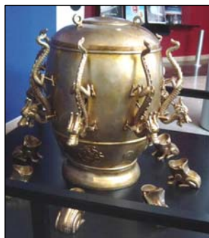
图：张衡发明了世界上第一台候风地动仪。

中华传统文化讲究天人合一，儒、释、道的修炼文化构成了中华文明的精粹，很多古代科学家同时也是修炼人，中国古代科技也因此在世界