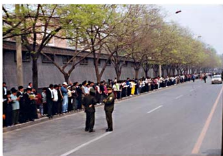
图：秩序井然的“四二五”上访民众

化、理念的破坏，代之以党文化对民众长期的洗脑，让很多人以为很多人去上访就如何如何，其实上访者只是在行使自己的合法权利。