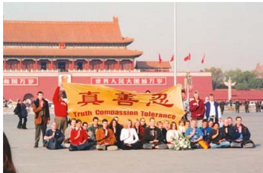
2001 年 36 位西方法轮功学员天安门请愿

法轮功修炼者身上看到了中华民族的希望！我们不能看到正义、道德、良知被践踏！不能看到好人被冤枉、被残酷的迫害，帮助他们是我们的责任！我们不应麻木、懦弱、冷血、亵渎责任！如果无辜的好人被非法审判治罪，若干年后这个荒谬的历史会让我们的后代难以理解！这将凸显了我们这个时代的自私、疯狂、急功近利，形成会有人不择手段用人血馒头邀功请赏！它还将告诉我们那些打着各种神圣名义的罪恶将得以大行其道！”