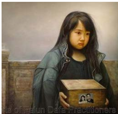
图：油画《孤儿泪》，2006 年，董锡强。中共的迫害造成了无数法轮功学员的家破人亡。

泽东那样按比例杀人，也不象邓小平那样在天安门广场上速战速决，他采取的是将人绑架进监狱后的虐杀。这集中体现在他对法轮功学员的迫害中。杀害的方式有两种，一种是虐杀，“打死白打死，打死算自杀，不查身源直接火化”；另一种更令人发指的罪恶，就是将法轮功学员的器官活体