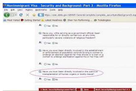
美国非移民签证申请表 DS-160 截图

1999 年 7 月 20 日迫害法轮功开始到 2006 年 5 月，中共中央军委开过六次