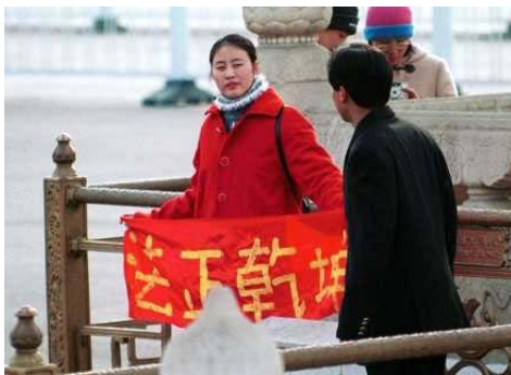
法轮功学员天安门广场打横幅

五名律师分别来自北京市京昌律师事务所、北京市凯泰律师事务所、北京市京振邦师事务所、北京市佳律师事务所和江西省明理律师