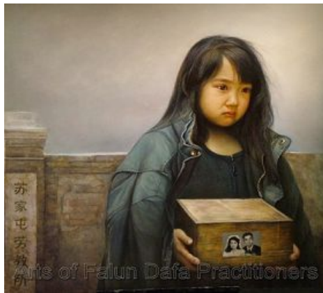
图：油画《孤儿泪》，2006年，董锡强。中共的迫害造成了无数法轮功学员的家破人亡。画中的孩子，父母双双被迫害致死，孩子满腹辛酸，隐忍着眼泪，捧着父母的骨灰不知何去何从……

集中体现在他对法轮功学员的迫害中。杀害的方式有两种，一种是虐杀，“打死白打死，打死算自杀，不查身源直接火化”；另一种更令人发指的罪恶，就是将法轮功学员的器官活体摘取，贩卖牟利。