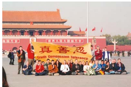
2001 年 36 位西方法轮功学员天安门

法轮功修炼者身上看到了中华民族的希望！我们不能看到正义、道德、良知被践踏！不能看到好人被冤枉、被残酷的迫害，帮助他们是我们的责任！我们不应麻木、懦弱、冷血、亵渎责任！如果无辜的好人被非法审判治罪，若干年后这个荒谬的历史会让我们的后代难以理解！这将凸显了我们这个时代的自私、疯狂、急功近利，形成会有人不择手段用人血馒头邀功请赏！它还将告诉我们那些打着各种神圣名义的罪恶将得以大行其道！”