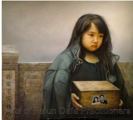
图：油画《孤儿泪》，2006年，董锡强。中共的迫害造成了无数法轮功学员的家破人亡。画中的孩子，父母双双被迫害致死，孩子满腹辛酸，隐忍着眼泪，捧着父母的骨灰不知何去何从……

将人绑架进监狱后的虐杀。这集中体现在他对法轮功学员的迫害中。杀害的方式有两种，一种是虐杀，“打死白打死，打死算自杀，不查身源直接火化”；另一种更令人发指的罪恶，就是将法轮功学员的器官活体摘取，贩卖牟利。