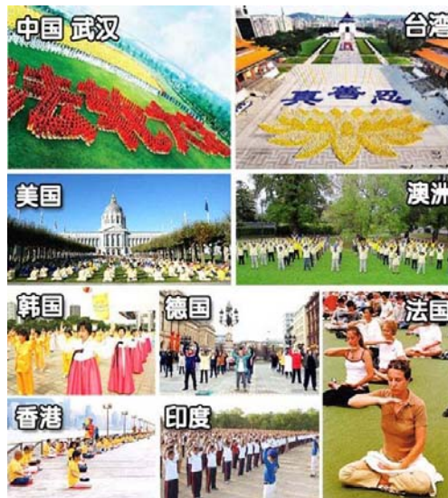
图：法轮大法在世界各地弘传，中国是世界上唯一一个打压法轮功的国家。