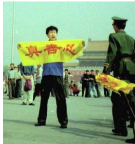
图：法轮功学员在天安门广场展开“真善忍”横幅，和平抗议中共对法轮功的非法迫害。

律师们还指出：“我们不只是为法轮功而呼吁，更重要的是为中华民族的道德、良知而伸张正义。我们从法轮功修炼者身上看到了中华民族的希望！我们不能看到正义、道德、良知被践踏！不能看到好人被冤枉、被残酷的迫害，帮助他们是我们的责任！我们不应麻木、懦弱、冷血、亵渎责任！如果无辜的好人被非法审判治罪，若干年后这个荒谬的历史会让我们的后代难以理解！这将凸显了我们这个时代的自私、疯狂、急功近利，形成会有人不择手段用人血馒头邀功请赏！它还将告诉我们那些打着各种神圣名义的罪恶将得以大行其道！”