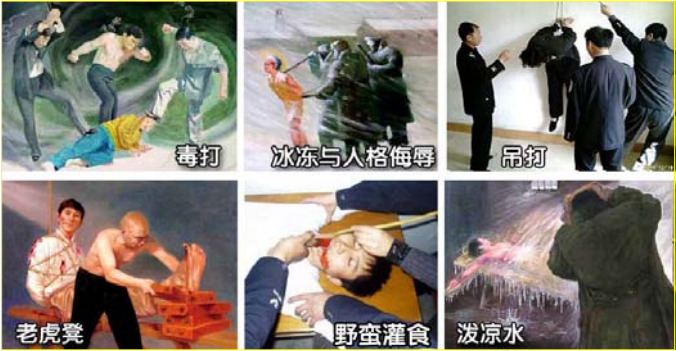
中共迫害法轮功学员的酷刑有四十多种

超过 10 万人被非法劳教，数千人被强迫送入精神病院受到破坏中枢神经药物的摧残，几十万人次被绑架到各地“洗脑班”遭受精神折磨，更多人受到所谓“执法人员”的酷刑折磨、体罚和经济敲诈。无数法轮功学员被迫害得家破人亡，妻离子散，流离失所。◇