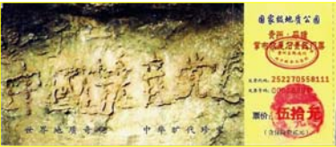
贵州省平塘县风景区门票

回顾中共执政60多年以来的几十场政治运动，从土改、镇反、三反、五反、反右、大跃进、文革、六四到迫害法轮功，中国人有一半以上受到过中共的迫害。而每一次运动，无一不是中共先来挑起事端，制造迫害的借口，进而大开杀戒。据不完全统计，有8000多万中国人在中共执政期间非正常死亡，这个数字是第一次世界大战死亡人数的8倍，是第二次世界大战死亡人数的1.5倍。再看当今中国社会：道德沦丧，工人失业，农民失地，贪官横行，官商勾结，警匪一家，百姓怨声载道。这样罪恶累累的中共，上天还能容它吗？2002年6月，在贵州省平塘县掌布乡，亿年古石突现“中国共产党亡”，经国家级地质专家考察证实：上面的字是天然形成。看来，灭亡中共，这是天意！