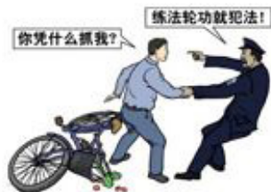
1、下班途中，遭遇非法绑架