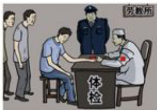
2、强制采血，建立活体器官库