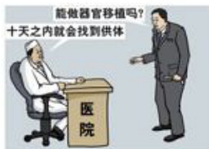
3、谋取暴利，医院与劳教所勾结