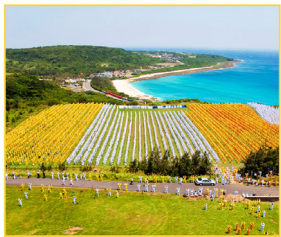
◎ “四·二五” 光照千秋的道德丰碑 ◎ 跨越民族界限 收获修炼之福 ◎ 长春电视插播：以生命的代价传播真相