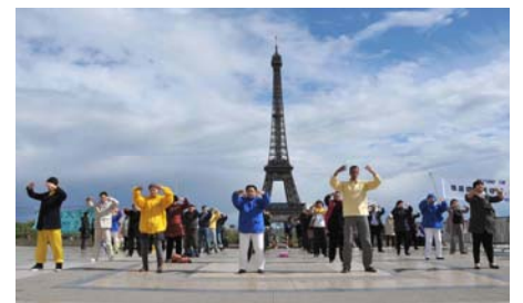
图：纪念四·二五和平上访，法轮功学员在巴黎人权广场上集体炼功。

一群中国游客也来到了人权广场，他们站在旁边认真地听着法轮功学员讲述被迫害的经历，随后又观看了展板，最后拿了真相资料才离开。巴黎法轮功学员成先生认为，中共对法轮功进行了十三年的迫害，这是一场毫无理由的迫害，江泽民、罗干、周永康、刘京等迫害元凶对法轮功学员犯下了滔天罪行。要让更多的人了解这个真实情况，希望所有的中国民众觉醒过来，制止这场迫害，法办江、罗、周、刘，还给中国人民信仰自由。