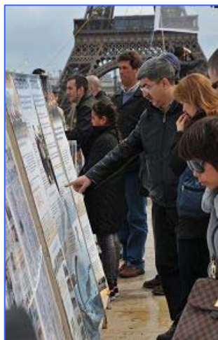
游人观看法轮功真相展板