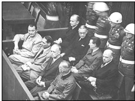
图：纽伦堡审判图片。1945年二战结束后，纽伦堡国际军事法庭否决了迫害帮凶们“奉命行事”的辩解。

二零零九年二月，由联合国推动的群体灭绝案法庭在柬埔寨首都正式开庭，以战争罪、反人类罪、酷刑及谋杀罪指控，开始对前波尔布特共