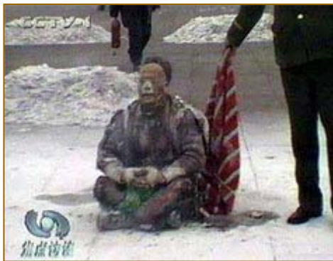
图：“自焚”是中共一手导演拍摄的煽动仇恨的假戏。

明慧网 2010 年 10 月 13 日发表文章，大陆一位知情者披露，2001 年过年前，他所在单位领导告诉他，