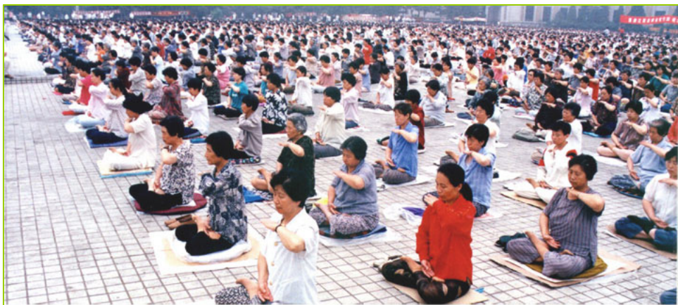
1998 年 5 月，沈阳万名法轮功学员集体炼功

就在这个时候，我们的一个远方亲戚来了，对我妻子弘扬大法，还带来了大法的书籍《转法轮》。从那时起妻子就一直拜读《转法轮》。嘿，她的身体恢复得越来越快，已经是个很好的人了。本来第四个放疗疗程不想再做了，但亲朋好友再三劝说，无奈之下才又进行了四十三天的放疗治疗。可是这个时候妻子已经得大法了，虽然身体在受着放疗的摧残，但她一直坚持学《转法轮》，又坚持炼