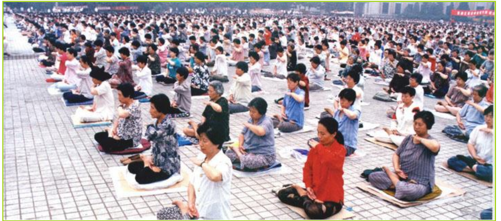
1998 年 5 月，沈阳万名法轮功学员集体炼功

就在这个时候，我们的一个远方亲戚来了，对我妻子弘扬大法，还带来了大法的书籍《转法轮》。从那时起妻子就一直拜读《转法轮》。嘿，她的身体恢复得越来越快，已经是个很好的人了。本来第四个放疗疗程不想再做了，但亲朋好友再三劝说，无奈之下才又进行了四十三天的放疗治疗。可是这个时候妻子已经得大法了，虽然身体在受着放疗的摧残，但她一直坚持学《转法轮》，又坚持炼