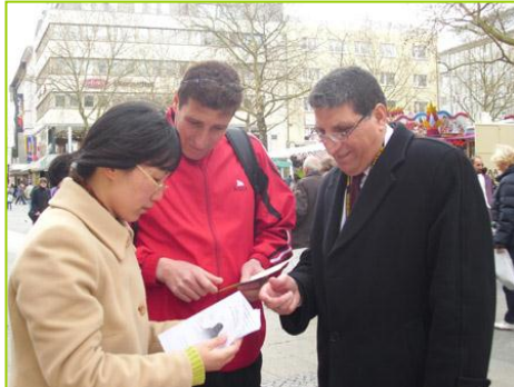
巴勒斯坦的世乒赛球员在听真相

德国多特蒙德市是一座体育名城，今年是第三次举办世乒赛，迎来了六万名来自超过一百四十个国家的参与者。世乒赛期间，很多国家的民众通过法轮功学员了解到，中国除了乒乓球有名外，更有一种气功受到欢迎，在中国曾有一亿人修炼，如今