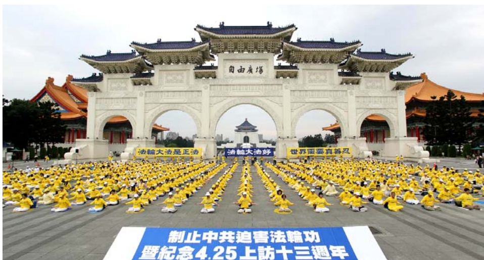
图：2012年4月22日，台北自由广场上纪念“4·25”大上访十三周年活动。

先，并不是上访导致迫害。四二五上访本身是在依法反迫害，是中共江泽民的邪恶本性导致了迫害的发生。