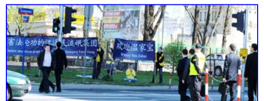
图：中共官员观看法轮功条幅。

【明慧网】四月二十五日下午，温家宝到达华沙后，无论是在总理府参加会谈，还是前往烈士纪念碑献花，无论是在华沙浴宫公园内出席晚宴，还是回旅馆中休息，车队所到之处都能看到法轮功学员高举横幅，抗议中共十三年对法轮功修炼者灭绝天良的持续迫害，横幅上写着中、波两种文字“法轮大法好”、“欢迎温家宝”、“法办迫害法轮功的江泽民流氓集团”等字样。每年的“四·二五”，波兰法轮功学员都会到中共使馆门前，呼吁停止迫害。