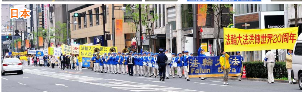
图：全球纪念“四·二五” 坚守正义 呼唤良知