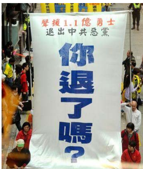
图：香港声援一亿一千万同胞三退

自二零零四年底《九评共产党》发表以来，很快即掀起了三退大潮。中共六十多年来给中华民族带来的深重灾难，虐杀了八千多万炎黄子孙，尤其是近十几年来残酷迫害法轮功，诋毁对“真、善、忍”的信仰，摧毁中国人的道德基石，带来了种种难以解决的社会问题。了解了这些，破除了党文化，明智的人们纷纷抛弃中共。