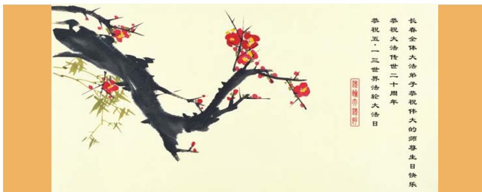
图：明慧网5·13“世界法轮大法日”贺卡（长春大法弟子，2012年）

仅凭他们崇高的自我牺牲，艰苦地实践真、善、忍道德理想的艰辛感人的历史过程，他们难道不是社会、人类以及未来的真正的希望么？人啊人，我希望你们能和我一样，做一些这样的思考。（一二年五月三日，于美国。注：本文为选摘）◇