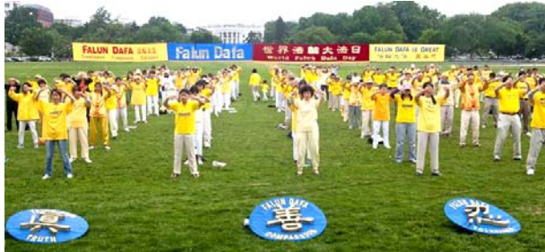
图：在白宫外的南草坪集体炼功