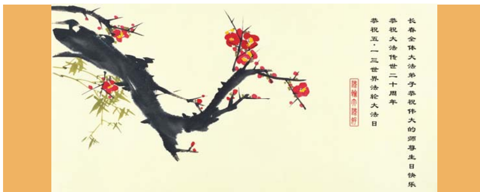
图：明慧网 5·13 “世界法轮大法日”贺卡（长春大法弟子，2012 年）

仅凭他们崇高的自我牺牲，艰苦地实践真、善、忍道德理想的艰辛感人的历史过程，他们难道不是社会、人类以及未来的真正的希望么？人啊人，我希望你们能和我一样，做一些这样的思考。（一二年五月三日，于美国。注：本文为选摘）◇