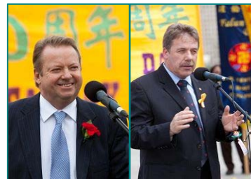
■国会议员杰·阿斯斌、新民主党国会议员斯多夫