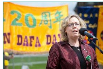
■绿党党魁、国会议员梅