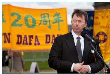
■加拿大国会议员罗伯·安德斯