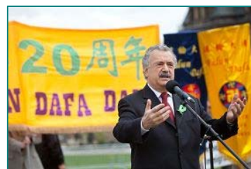
■加拿大参议员蒂尼诺