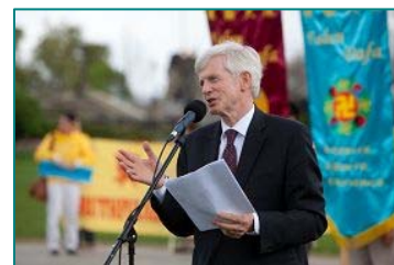
■加拿大前亚太司司长大卫·乔高