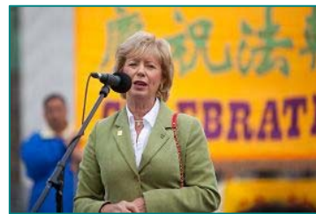
■自由党资深议员斯格诺女士