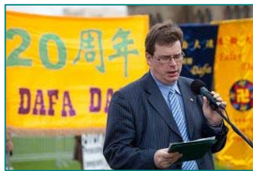
■加拿大国会议员拉施伯格