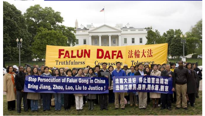
国际法轮功学员在大使馆前请愿，并呼吁停止迫害。

1999 年，江泽民一手挑起对法轮功的迫害，灭绝人性地对法轮功学员施行“名誉上搞臭、经济上搞垮、肉体上消灭”的政策。目前至少 3514 人被迫害致死，6000 多人被非法判刑，十几万人被非法劳教，数十万人被拘留、被绑架到各地洗脑班迫害。更有无法计数的法轮功学员被中共秘密活摘器官，牟取暴利，再被焚尸灭迹。十余年来，这场迫害被国际社会称为“21 世纪最大的人权灾难”、“这个地球上从未有过的罪恶”。