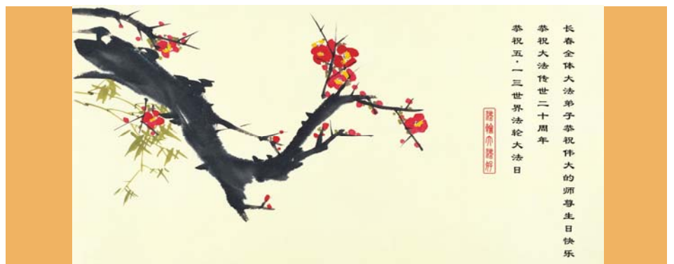
图：明慧网 5·13 “世界法轮大法日”贺卡（长春大法弟子，2012 年）

仅凭他们崇高的自我牺牲，艰苦地实践真、善、忍道德理想的艰辛感人的历史过程，他们难道不是社会、人类以及未来的真正的希望么？人啊人，我希望你们能和我一样，做一些这样的思考。（一二年五月三日，于美国。注：本文为选摘）◇