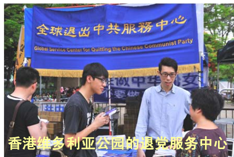
香港维多利亚公园的退党服务中心

义工问一位中年男子：“入过党吗？”对方回答：“不仅入过党，我还管党员呢？”义工说：“那您是党委书记了？”对方说：“那你说对了。”义工说：“我帮你起个化名退了吧？”那人说：“那就退了吧。”◇