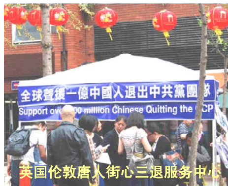
英国伦敦唐人街心三退服务中心

一声大喊：“法轮大法好！真、善、忍好！”我回头一看，她正伸展开双臂，对着雨中的天空转着圈，尽情的呼喊呢。。我急忙跑到她站的地方问她：“脚好了吗？”“好了？”她兴高彩烈的一边回答一边跺脚让我看，然后又展开双臂一边转圈一边继续对着天空纵情的呼喊：“法轮大法好！真、善、忍好！”雨水顺着她的头发和脸直往下淌，她毫不理会。“法轮大法好”的呼喊声带着她内心的喜悦传出去很远。这时雨突然停了，她边走边兴奋的说：“法轮功太神了！”